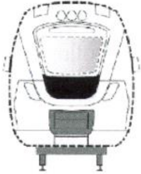
Perspetivas dianteira e traseira