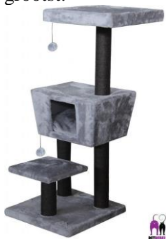
Kings & Queens Maxima 114

B. De artikelen van het model Kings & Queens (Kings & Queens Arthur 123, Kings & Queens Elisabeth 135, Kings & Queens Maxima 114, Kings & Queens Cleopatra 122, Kings & Queens Cleopatra 143, Kings & Queens Victoria 45, Kings & Queens William 120), bestaande uit één of meerdere met sisaltouw omwikkelde palen. De overige onderdelen zijn omkleed met pluche. Het aandeel van het pluche is in oppervlakte het grootst.