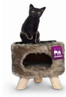
Kings & Queens Victoria 45

Het type Victoria betreft een hoofdzakelijk met pluche aan binnen- en buitenzijde omklede box met een opening, die op drie houten pootjes staat. De pootjes hebben geen bekleding. In dit artikel is verder geen ander materiaal zoals sisal touw of sisal mat verwerkt.