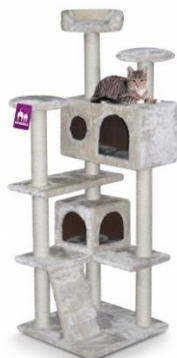
Cheap Bastard New York 132

A. De artikelen van het model Cheap Bastard (Cheap Bastard Atlanta 60, Cheap Bastard Boston 60 / 90, Cheap Bastard Maine 90, Cheap Bastard Chicago 175, Cheap Bastard Dallas 69, Cheap Bastard Houston 109, Cheap Bastard Miami 245, Cheap Bastard New York 132, Cheap Bastard Phoenix 240, en Cheap Bastard Washington 82), bestaande uit één of meerdere met sisaltouw omwikkelde palen, de overige onderdelen zijn omkleed met pluche. Het aandeel van het pluche in de omkleeding, gemeten in oppervlakte, is het grootst, behalve bij het type Cheap Bastard Maine. Daarbij is het aandeel van het sisal wat betreft de oppervlakte van materiaal het grootst.