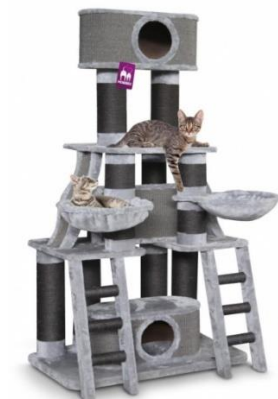
Lucky Bastards Skyline 185

D. De artikelen van het model Lucky Bastards (Lucky Bastards Skyline 160, Lucky Bastards Skyline 185), bestaande uit diverse met sisaltouw omwikkelde palen, de overige onderdelen zijn omkleed met pluche. Het aandeel van het pluche is in oppervlakte het grootst.