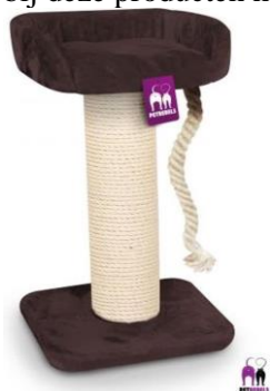
Rebels Main Coon 100

E. De artikelen van het model The Rebels (The Rebels Main Coon 100, The Rebels Main Coon 173, The Rebels Main Coon 120), bestaande uit één met sisaltouw omwikkelde paal. De overige onderdelen (mandje en/of platforms) zijn omkleed met pluche. De Main Coon 173 is verder nog voorzien van een sisal touw. Het aandeel van het pluche is bij deze producten het grootst.