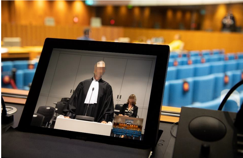
Ansicht des Fernstandorts auf dem Bildschirm der Richter bzw. Dolmetscher