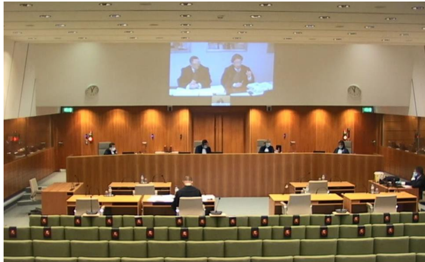
Großaufnahme des Sitzungssaals