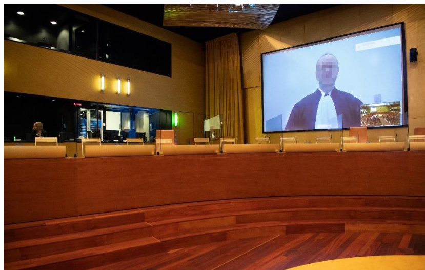
Ansicht des Fernstandorts auf dem Bildschirm des Sitzungssaals