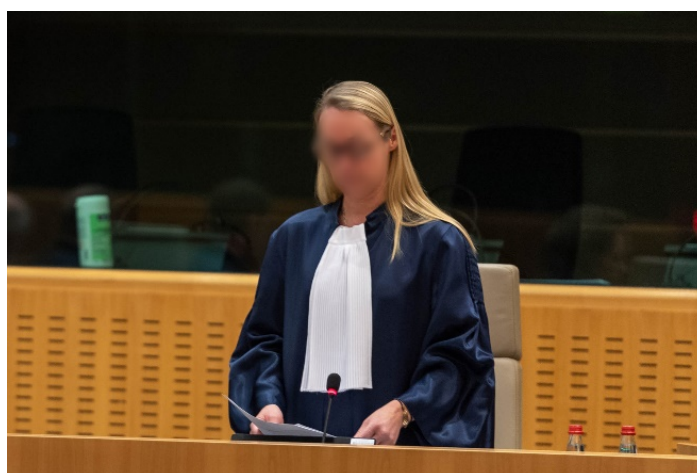
Différentes vues sur les orateurs