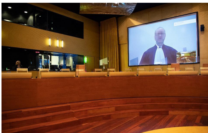
Vue du site distant sur l'écran de projection de la salle d'audience