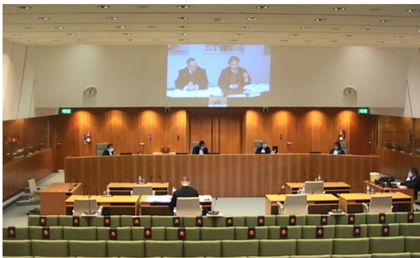
Plan large de la salle d'audience