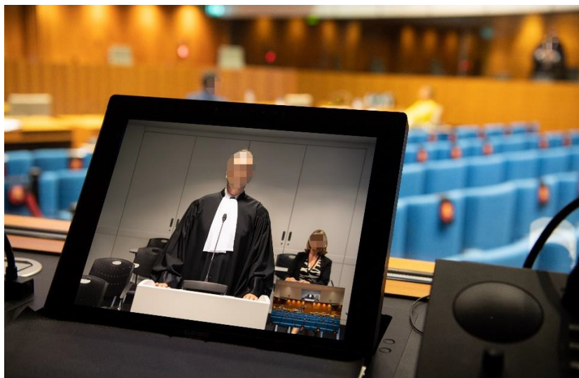
Vue du site distant sur l'écran des juges et des interprètes